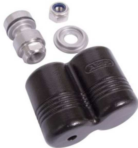
ABUS 808 Reef ab ca. 130 €